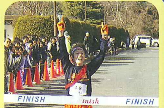
日立駅伝競走大会