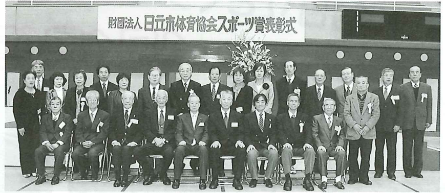
※写真はスポーツ功労賞受賞者