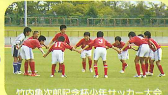
竹内亀次郎記念杯少年サッカー大会