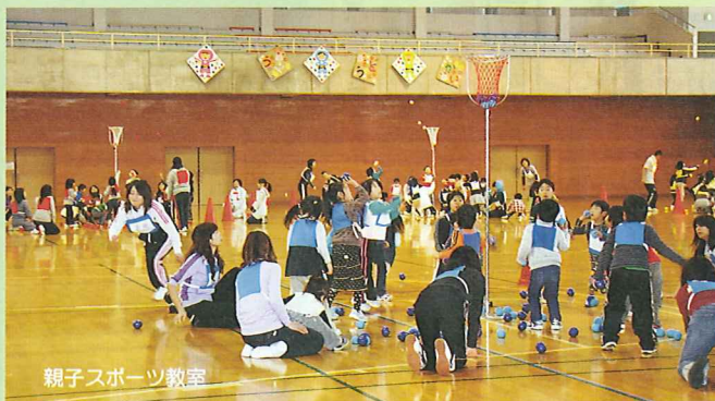
親子スポーツ教室